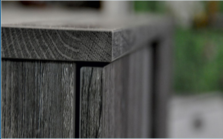
EFS Timber-Line Detail / Hirnholzkante