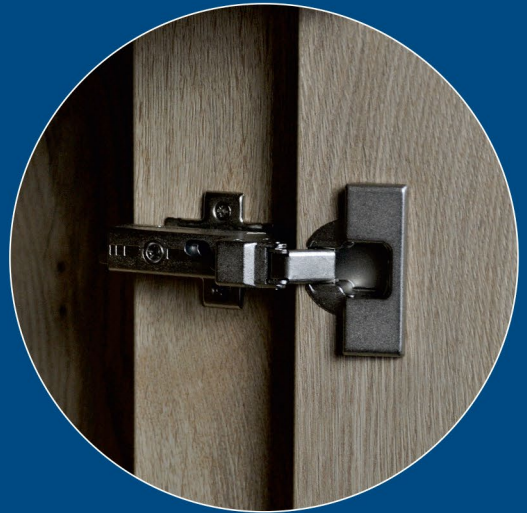
EFS Timber-Line Detail / hochwertiges Soft-Close Scharnier