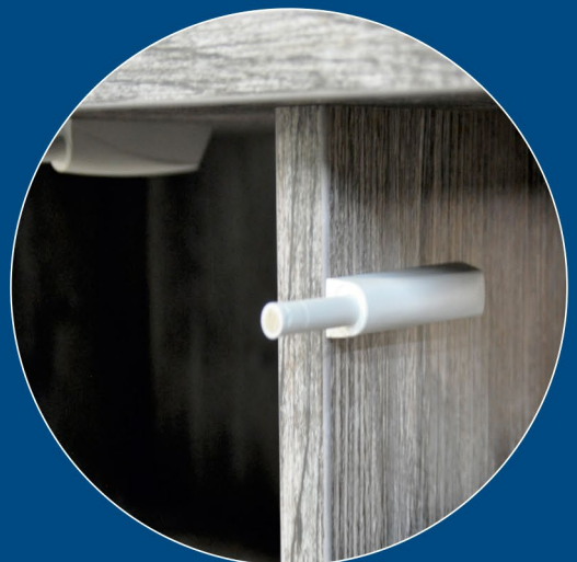
EFS Timber-Line Detail / push-to-open