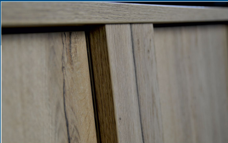
EFS Timber-Line Detail / kräftige Säulen