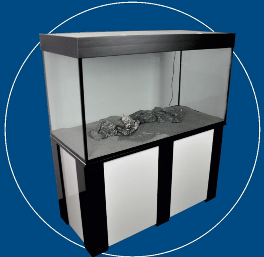
EFS Timber-Line Kombi in vielen Dekorkombinationen lieferbar